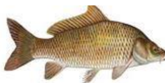
Карп обыкновенный (чешуйчатый)